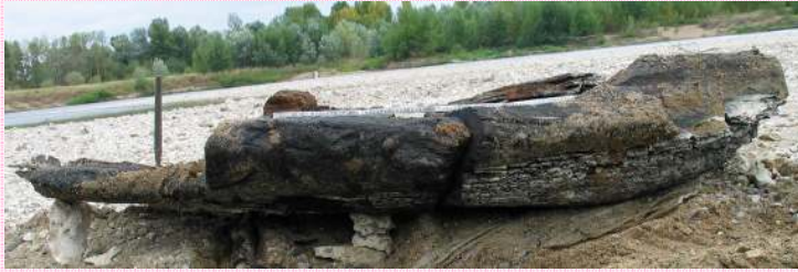
Figure 1. Port Foucault, Fondettes (Indre-et-Loire). La pirogue monoxyle vue de profil ; la dégradation du bois est très visible à l'avant, sur les plats-bords et sur le fond à gauche du gradin ; celui-ci au contraire semble bien conservé.

L'extrémité d'une pirogue monoxyle (figure 1) a été trouvée en 2004 à Fondettes (Indre-et-Loire), sur une grève au milieu du lit mineur de la Loire. Ce fragment a une longueur de 2,5 m. L'embarcation avait une largeur d'environ 1 m, sa longueur est inconnue. En dehors des cinq premiers centimètres, le bois de chêne est en très bon état de conservation. Cette découverte est remarquable car une datation dendrochronologique a été possible. Elle donne une date de 384 avant notre ère pour l'abattage du chêne. Elle situe la construction de cette embarcation au début du second Âge du Fer. Pour les Âges du Fer, en dehors de la Grande-Bretagne où elles sont nombreuses, l'inventaire publié en 1996 ne donne en Europe, à l'ouest du Léman, que deux pirogues (une sur la Saône, l'autre sur la Loire près de Nantes) (Arnold, 1995, 1996).