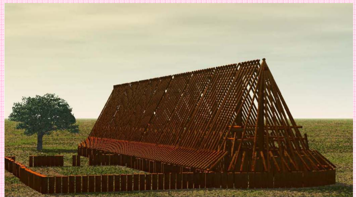
Restitution de la maison des Vaux réalisée par Medhi CHAYANI, dans le cadre d'un stage sous la direction de Jean Vaquer.

Par Tony HAMON , archéologue à l'Institut National de Recherches Archéologiques Préventives.