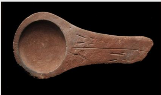
"Nombreuses furent les lampes collectées, mais toutes ne s'identifiaient pas au brûloir en grès rouge retrouvé au pied de la Scène du Puits".