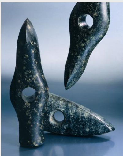
Haches perforées en roche tenace, provenant de villages lacustres du Néolithique final

Grâce à l'exceptionnelle conservation des vestiges organiques, les analyses des textiles, des bois, des graines et de biens d'autres objets fournissent des résultats étonnants sur la vie quotidienne des habitants de l'époque préhistorique.