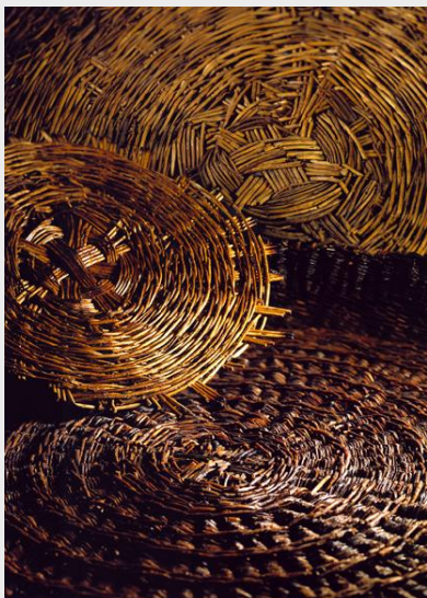
Vanneries néolithiques mises au jour lors des fouilles sur les rives du Lac de Neuchâtel

Depuis 1854, date de la découverte des premiers habitats du Néolithique et de l'Age du Bronze sur le Plateau suisse, des centaines de milliers d'objets ont été exhumés sur les rives des lacs, dont quelques centaines de lames du Grand-Pressigny. Que sont devenues ces collections ? Comment les gère-t-on ?