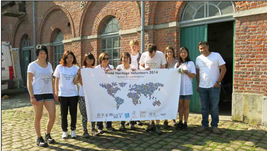
Les volontaires du Patrimoine mondial à Bois-du-Luc en 2014.