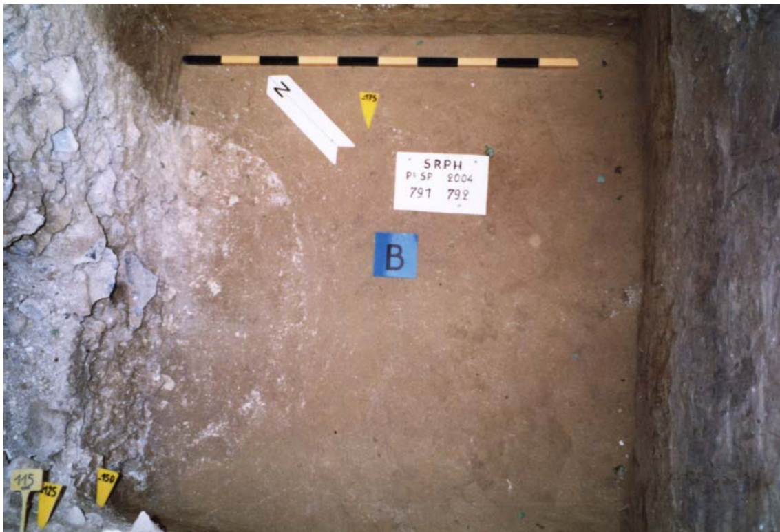
Structure 79.1 vue partielle de l'entonnoir et de la cheminée à -175 cm