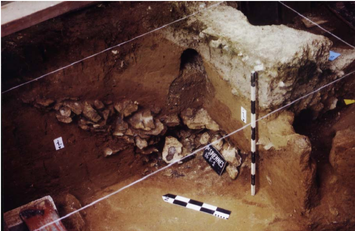
Structure 86.8.1 vue de l'ouest